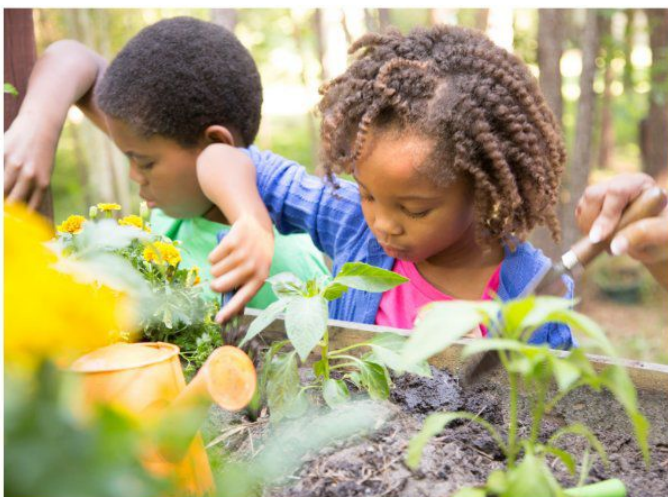
Des élèves en activité jardinage