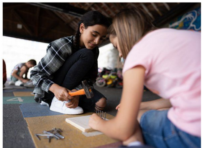
Des élèves construisent des supports à éponges tawashi